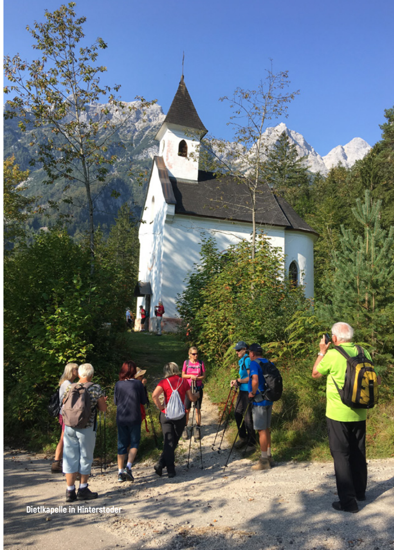
Dietkapelle in Hinterstoder

Details erhaltet ihr, auch über hier nicht angeführte Veranstaltungen, bei den Vereinsabenden, in den Schaukästen und auf unserer Homepage. Für weitere Informationen stehen die im Programm angeführten Verantwortlichen zur Verfügung. Es gelten die Datenschutzrichtlinien der Naturfreunde Österreich, ersichtlich unter www.naturfreunde.at/datenschutz/