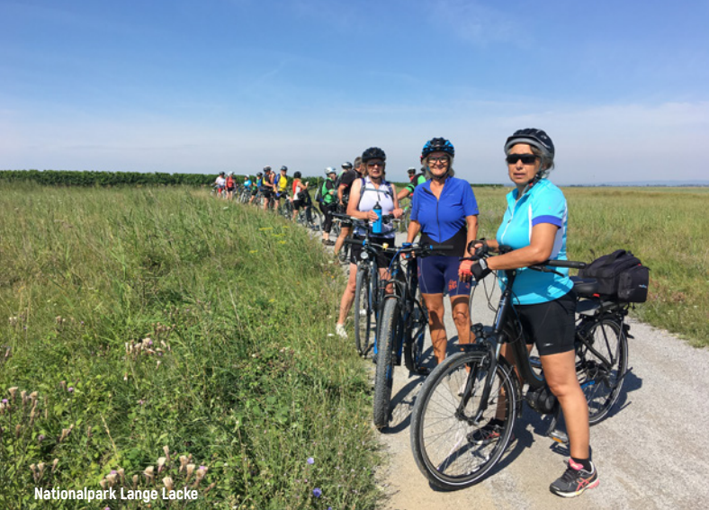
Nationalpark Lange Lacke