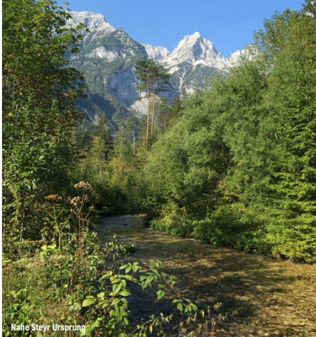
Nahe Steyr Ursprung

Aufgrund der aktuellen Vorsichtsmaßnahmen im Hinblick auf die Ausbreitung des Corona Virus bitten wir um Anmeldung bei jeder Veranstaltung!