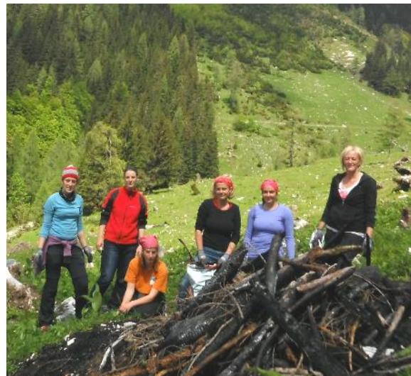
Schwenden – Arlingalm

In diesem Praxis-Kurs wird versucht die jahrhundertealte Steinbautechnik der Weinbauern mit den regionalen Steinbauformen der Bergbauern im Alpenraum zu verbinden. Weiters wird die geschützte Alpenflora besprochen und die Bedeutung seltener Gehölze für den Naturschutz vermittelt. Danach werden intelligente Almpflegetechniken im Einklang mit den Naturschutzzielen in Schutzgebieten vorgezeigt.