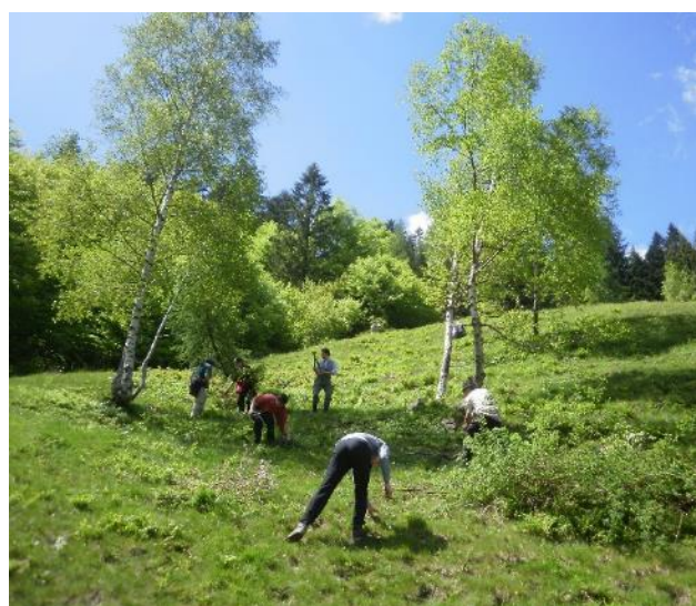
Anlage einer parkartigen Birkenweide, Gruberalm 2011