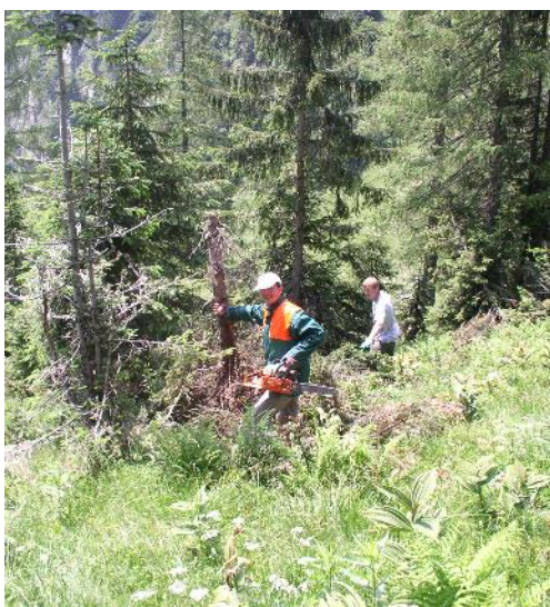
Gehölze schwenden, Weißer Germer