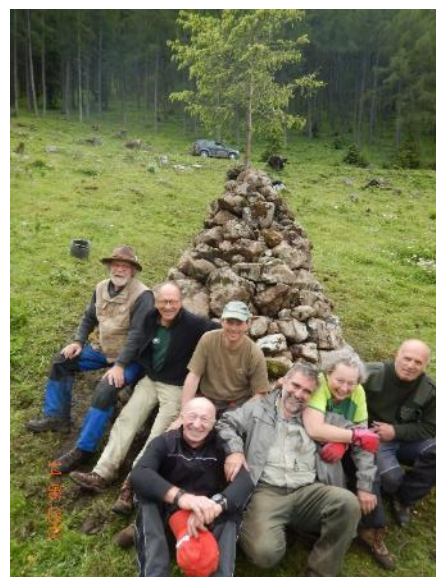
Steinkegel nach Vogler 2016