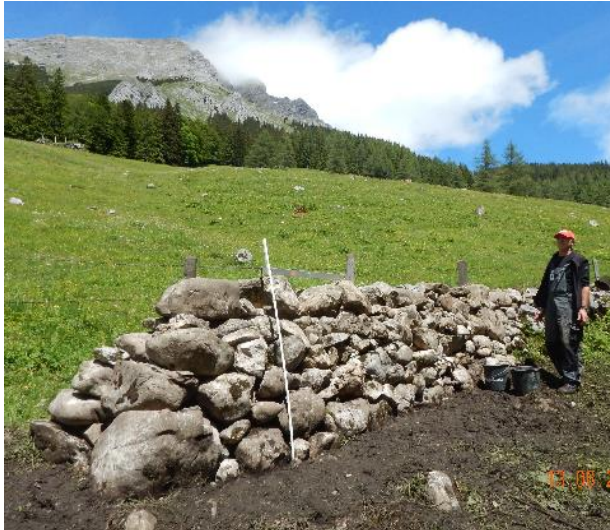
Steinwall (Steinlag) – Arlingalm, Spital am Pyhrn